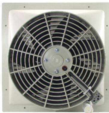
LS 3 (K)