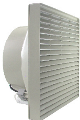
LS 3 K